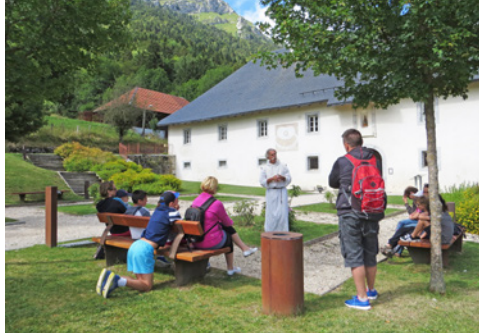
Visite costumée de la Chartreuse d'Aillon